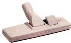
RF-520 W/B podesivi adapter za pod

Uz BEAM crevo za usisavanje dobijate teleskopsku cev i set raznih priključaka, pribora koje Vam omogućuju da usisate praktično sve, od poda do plafona. Pribori se mogu koristiti pomoću teleskopske cevi ili ih direktno možete spojiti na ručku.