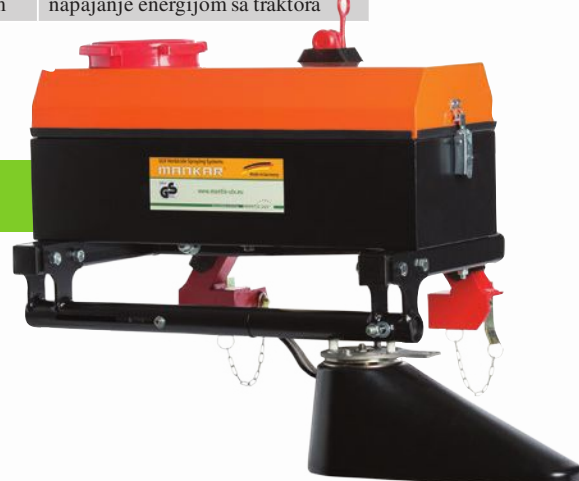
Unima-ONE-ES 40 Flex