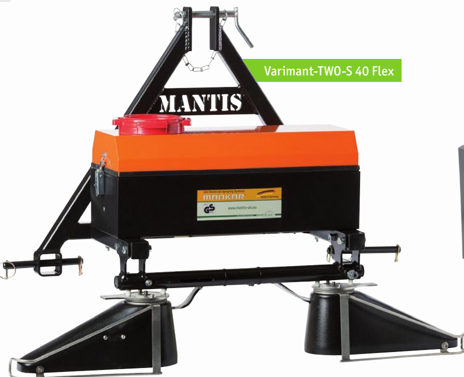
Varimant-TWO-S 40 Flex