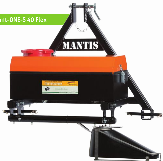
Varimant-ONE-S 40 Flex