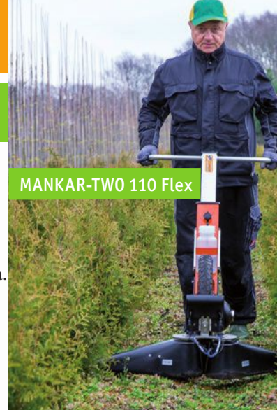
MANKAR-TWO 110 Flex

Elektronska dizna i kontrola punjive baterije daje signal putem LED diode ako postoji neka smetnja. Dobro vidljiva kontrola protoka je takođe prisutna.