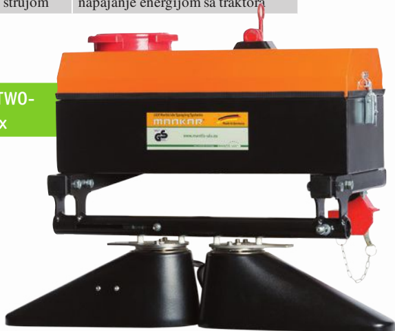
Unima-TWO-E 80 Flex