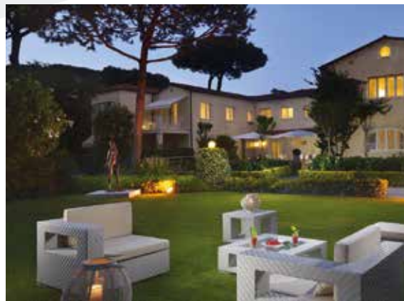
Vila Roma Imperiale, Forte dei Marmi (LU)