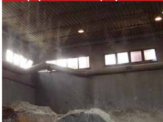
Smanjenje insekata na deponiji