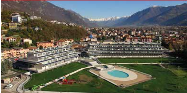
Dom Bersaglio, Jezero d'Iseo (BG)