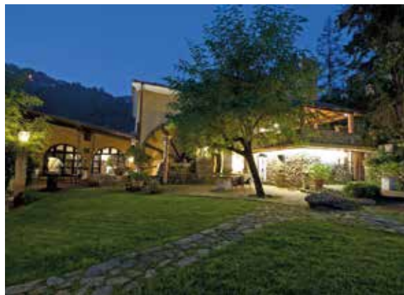
Il Bottaccio Relais i Chateaux, Montignoso (MS)