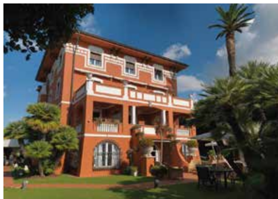
Hotel 1908, Forte dei Marmi (LU)