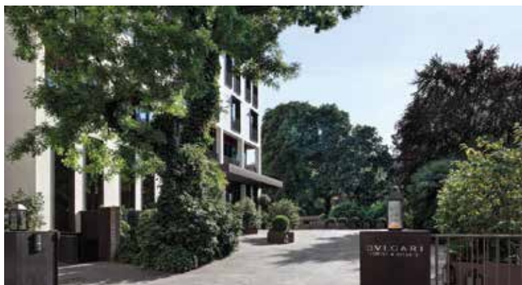
Bulgari Hotel, Milano (MI)