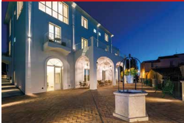
Relais Baronova Palata, Sorrento