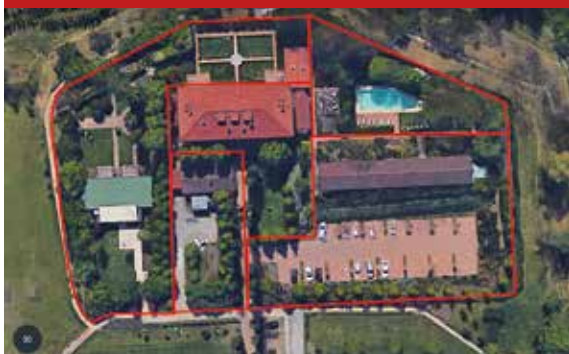
California Relais, Nibionno (LC)