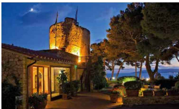
Hotel Torre di Cala Piccola, Porto Santo Stefano (GR)