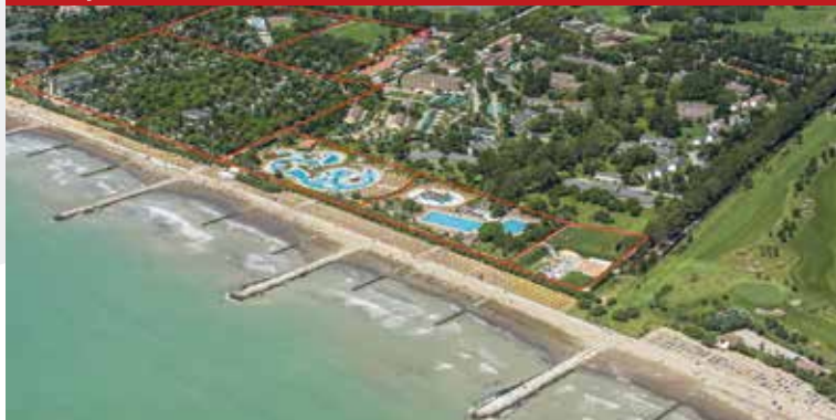
Kamp Prà delle Torri, Caorle (VE)

VIŠE OD 1000 SISTEMA PROTIV KOMARACA INSTALIRANIH SAMO U ITALIJI, FREEZANZ PREDSTAVLJA SIGURNOST, NEPREKIDNO ULAŽEMO U ISTRAŽIVANJA U CILJU DOBIJANJA JOŠ POUZDANIJIH I EFIKASNIJIH SISTEMA PROTIV KOMARACA.