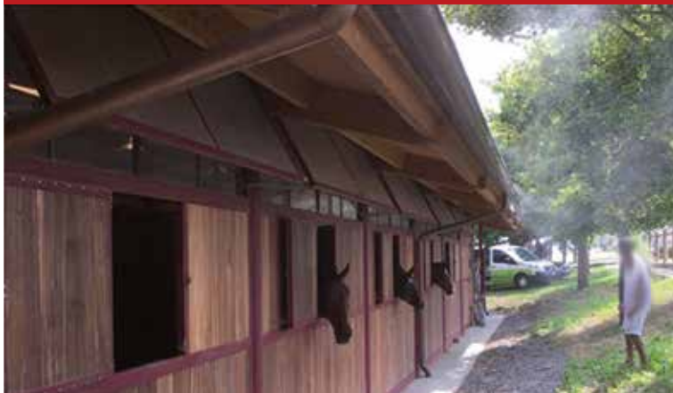
Štala u Monferatu