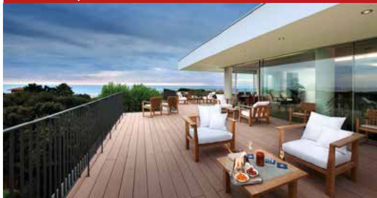
Hotel Principe, Forte dei Marmi (LU)