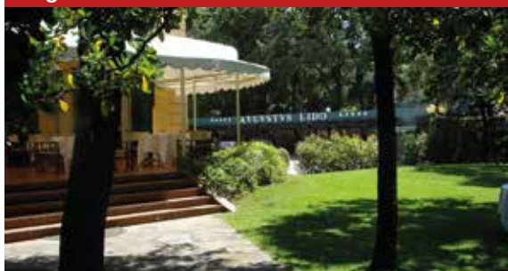
Augustus Hotel i Rezort, Forte dei Marmi (LU)