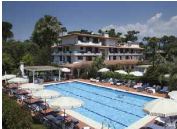
California Park Hotel, Forte dei Marmi (LU)