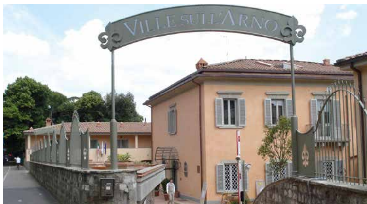
Hotel Ville sull'Arno, Firenze