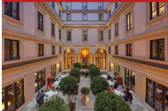
Hotel Mandarin Oriental, Milano (MI)