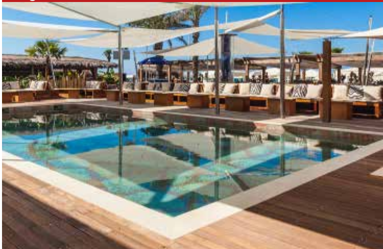
Twiga Plaža, Forte dei Marmi (LU)