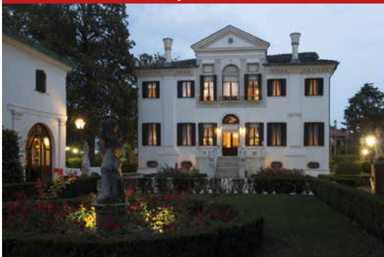
Vila Francheschi Mira, Venecija (VE)