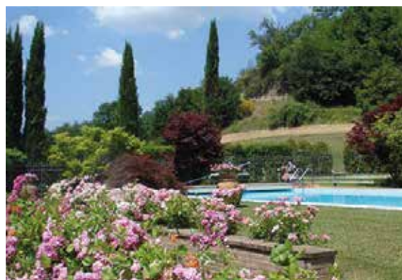
Odmaralište Tornia, Incisa Valdarno Reggello (FI)