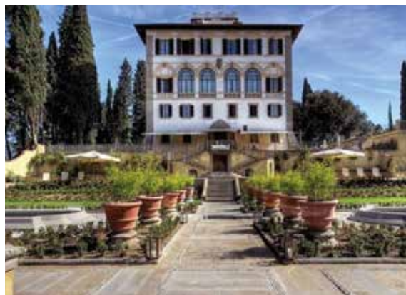
Hotel Il Salviatino, Fiesole (FI)