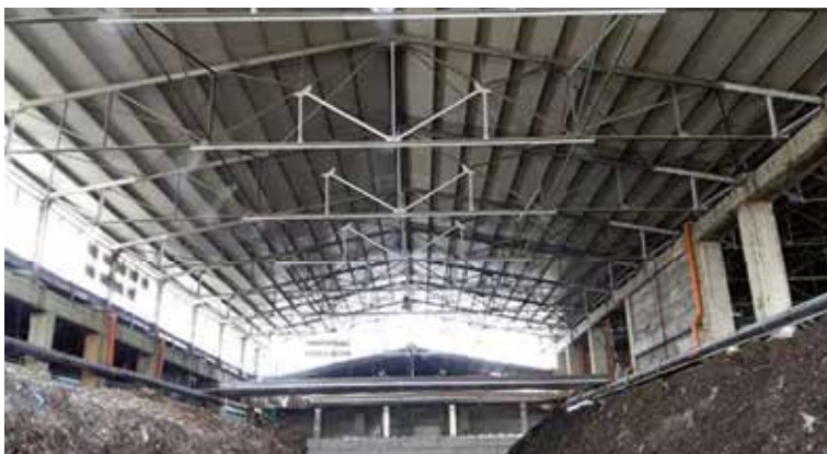
Smanjenje mirisa u skladištu

Realizovali smo sisteme za smanjenje mirisa i odbijanje insekata u industrijskim objektima, skladištima otpada i logističkim skladištima.